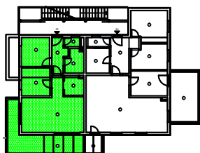
TLOCRT I. KATA